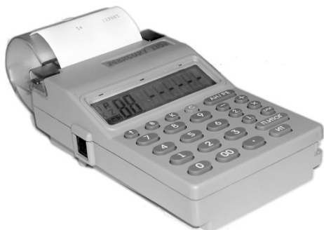
Рис. 1 Общий вид

Общий вид машины приведен на рис.1 Технические данные приведены в формуляре.